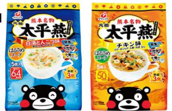
熊本名物『太平燕(タイビーエン)』 ※白湯とんこ味がチキン味のどちらか

熊本県産の商品を購入して熊本の応援をしようとする活動は、さまざまところで起こっています。献血の記念品を熊本県産の商品にすることで、熊本を応援します！ ※記念品は数に限りがあります。